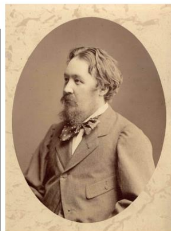
Konkoly Thege Miklós (1842-1916).